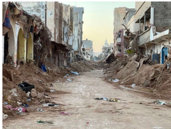
Una calle de Derna, el pasado 10 de septiembre, tras el paso del ciclón Damiel.

Solo el 30% de la financiación solicitada por la ONU para atender a las distintas crisis se había cubierto a mediados de septiembre. La Unión Europea debe liderar un cambio de rumbo