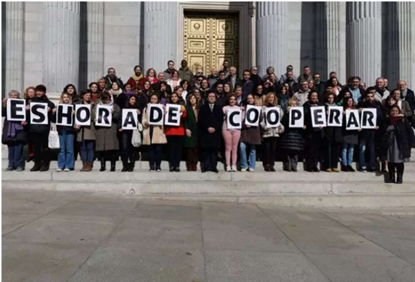
El ministro de Asuntos Exteriores, Unión Europea y Cooperación, José Manuel Albares (c), junto a un grupo de personas en las escalinatas del Congreso tras la aprobación de la nueva Ley de Cooperación Internacional para el Desarrollo Sostenible