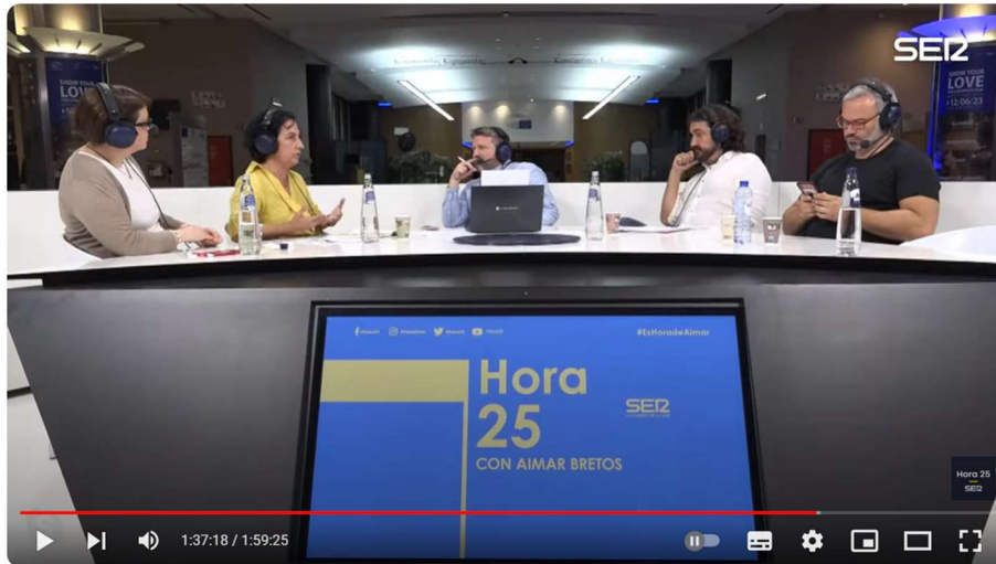
Hora 25 desde el Parlamento Europeo